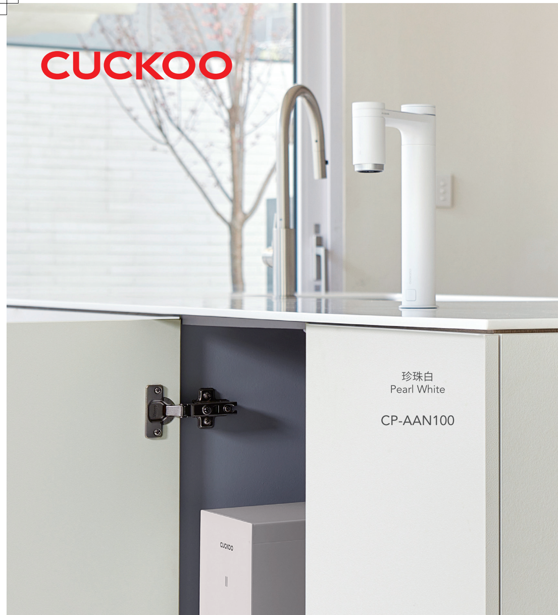
珍珠白 Pearl White CP-AAN100